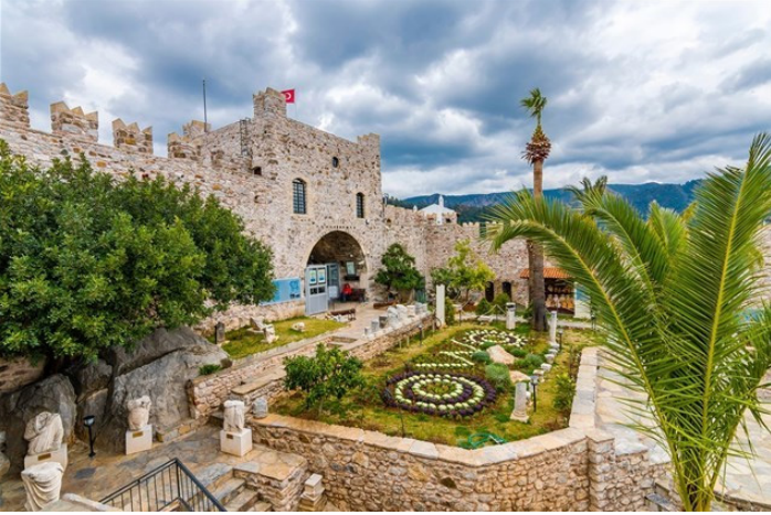
زوري المعالم التاريخية في المنطقة