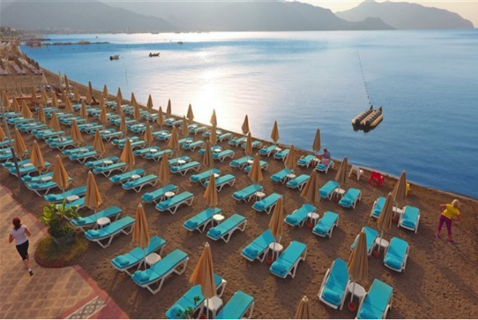
إسترخي تحت أشعة الشمس في مرمريس