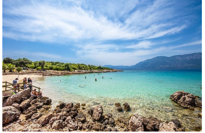
إقضي وقتاً لا ينسى بالقرب من شواطئ مرمريس النظيفة