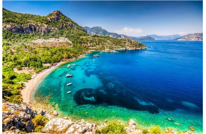
تألمي أجمل المناظر الطبيعية في المنطقة