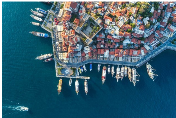
لا تنسي القيام بالنشاطات الرائعة كالذهاب في رحلة