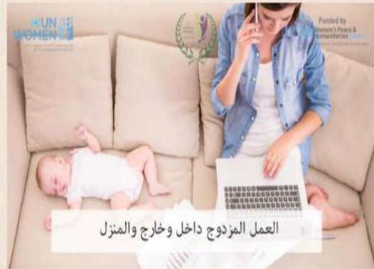
العمل المزدوج داخل وخارج المنزل