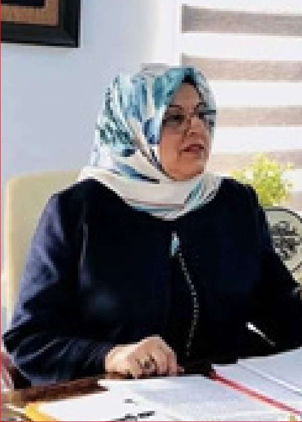
يوكسل مصطفى كمال ترزي باشي

مؤخراً نمط العنف في سلوكه والسبب يرجع لتقليده المشاهد العنيفة التي تؤذيها شخصيات الرسوم لكن في المقابل هناك أطفال عند مشاهدتهم لتلك الرسوم تفيده في جوانب عديدة منها تغذي قدراته على الإدراك وتزيد من ذكائه وتنمي خياله وتعرفه بطرق جديدة في التفكير والسلوك وتترك في نفوسهم حب الاطلاع والتحقيق. تأثير الرسوم المتحركة