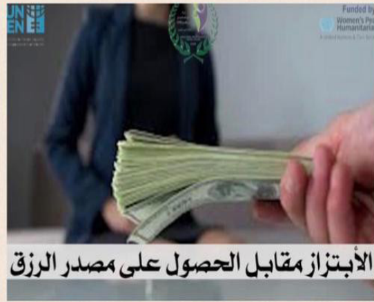
الأبتزاز مقابل الحصول على مصدر الرزق