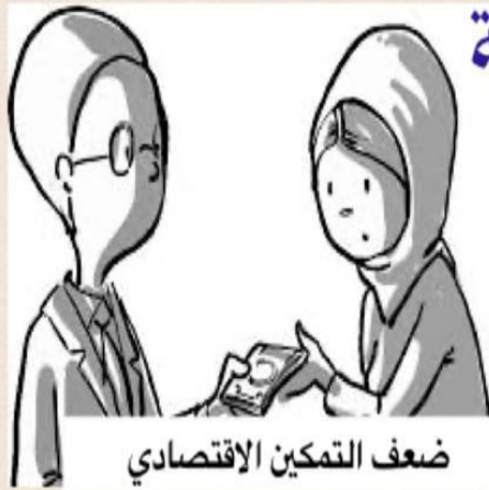
ضعف التمكين الاقتصادي