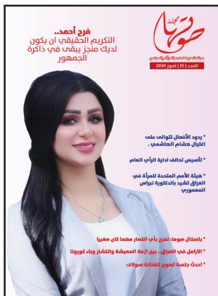
صورة الغلاف للاعلامية فرح احمد