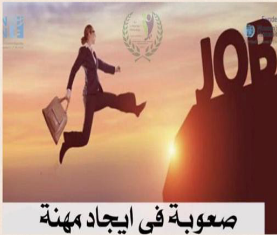
صعوبة في ايجاد مهنة