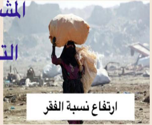
ارتفاع نسبة الفقر