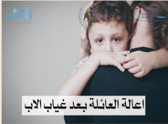
اعالة العائلة بعد غياب الاب