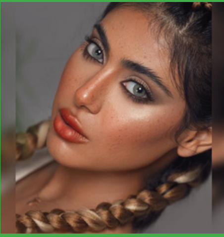
مكياج برتقالي مع تسريحة الضفائر المزدوجة