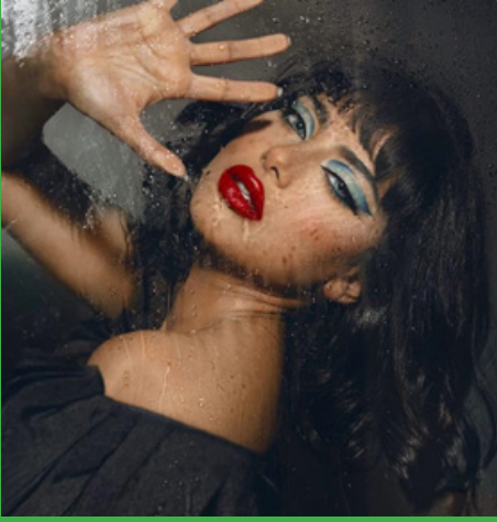
مكياج عيون غرافيكي أزرق مع تسريحة الويفي

تطل النجمة شيلاء سبت، بتسريحات شعر وأساليب مكياج تطغى عليها الجرأة والتميز، حيث تبرز ملامح وجهها بألوان مكياج قوية تواكب صيحات المكياج، وتعتمد تسريحات شعر أنثوية وأنيقة، خصوصاً التسريحات المرفوعة التي تسلط الضوء على جمال وجهها.