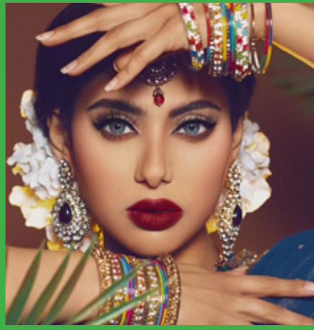
مكياج هندي قوي