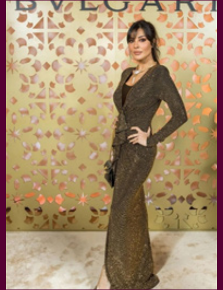
* نادين نسيب نجيم