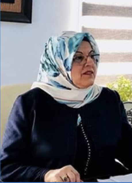
يوكسل ترزي باشي

أعلنت الجمعية العامة يوم ٢٥ تشرين الثاني اليوم العالمي للقضاء على العنف ضد المرأة ويعتبر هذا اليوم من كل سنة مناسبة هامة من أجل التذكير بضرورة وقف العنف ضد المرأة.