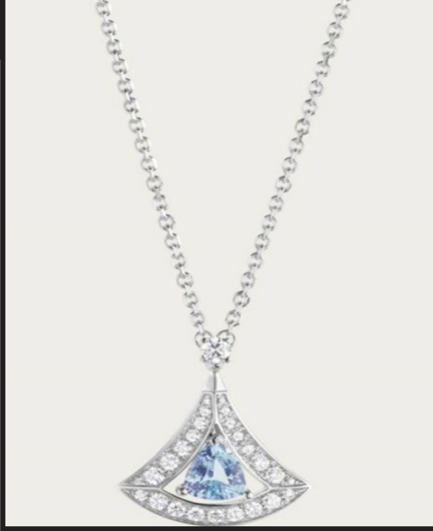
عقد ديفاز دريم من بولغاري Bvlgari

يَبْرُزُ اللون الأزرق بشكل كبير ضمن موضة خريف ٢٠٢١، ومع اقتراب موعد دخول فصل الخريف نرصد لكِ عدة تصاميم للمجوهرات المرصعة بالأحجار الزرقاء المختلفة؛ لتتمتعِي طوال الموسم بأسلوب مميز ومتألق يليق بذوقك وأناقتك.