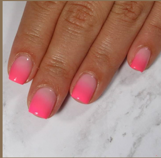
مناكير وردي نيون امبريه