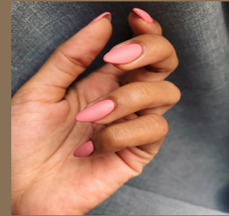
مناكير وردي ناعم