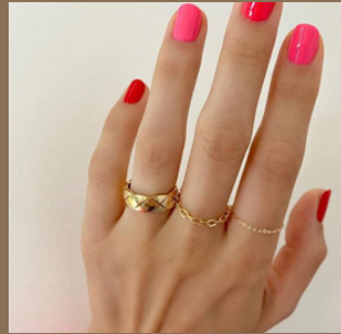
مناكير وردي مع ألوان قوية