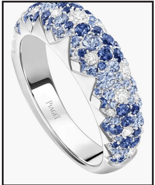
خاتم سنلايت من بياجيه Piaget