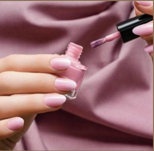
مناكير وردي مخطط بالاصفر

اجعلي من شهر أكتوبر الوردي فرصة لتجربة أجمل موديلات المناكير الوردي، خصوصاً أن المناكير الوردي يتناغم مع جميع ألوان البشرة، ويجعل اليدين والأظافر مشرقة ومضيئة، ويبث في المرأة المرح والحيوية والنشاط. اختاري طلاء أظافر وردياً بتركيبة مكثفة