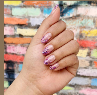
مناكير وردي غليتر