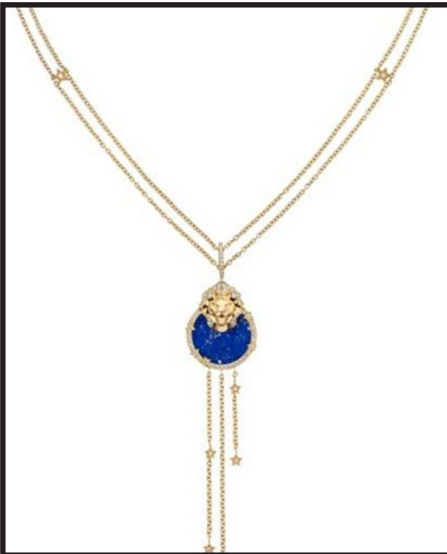
عقد LION MÉDAILLE من شانيل Chanel

يَبْرُزُ اللون الأزرق بشكل كبير ضمن موضة خريف ٢٠٢١، ومع اقتراب موعد دخول فصل الخريف نرصد لكِ عدة تصاميم للمجوهرات المرصعة بالأحجار الزرقاء المختلفة؛ لتتمتعِي طوال الموسم بأسلوب مميز ومتألق يليق بذوقك وأناقتك.